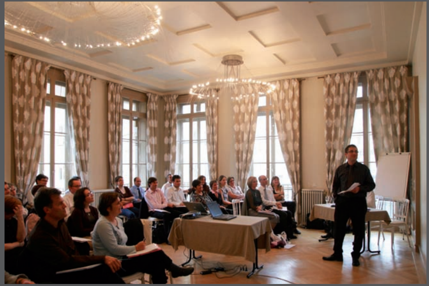
Salon Dorian 1