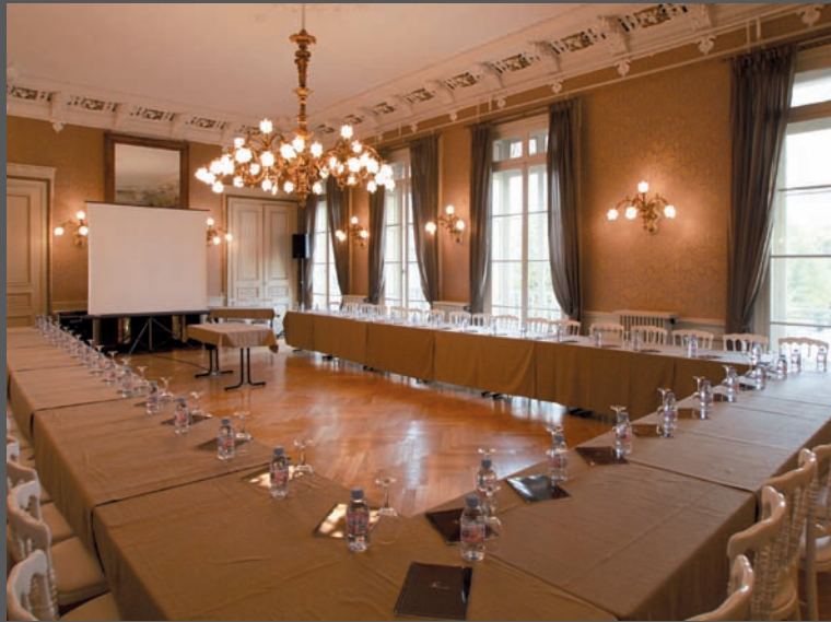
Le Grand Salon